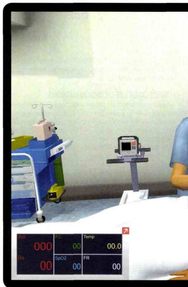
Simulation médicale numérique, serious games de sensibilisation... Interaction applique des solutions digitales à la santé.

La start-up caennaise Yousign a été créée en août 2013 par deux copains de promo tout juste sortis de l'école d'ingénieurs Ensicaen. Ils ont mis au point une solution de signa-