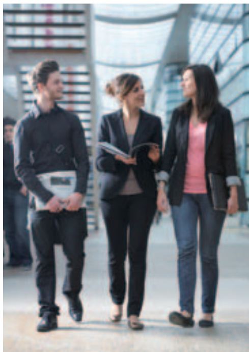
Utilisation de la taxe d'apprentissage 2010 à ESIEE Management