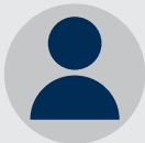
Elève ESIEE Paris Avis certifié Happy at School

« Un atout : la relation que nous avons avec les profs. Ils sont toujours là pour répondre à nos questions même hors des cours et veulent notre réussite. »