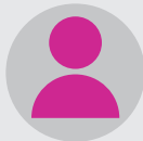
Elève ESIEE Paris Avis certifié Happy at School

« Un atout : la relation que nous avons avec les profs. Ils sont toujours là pour répondre à nos questions même hors des cours et veulent notre réussite. »